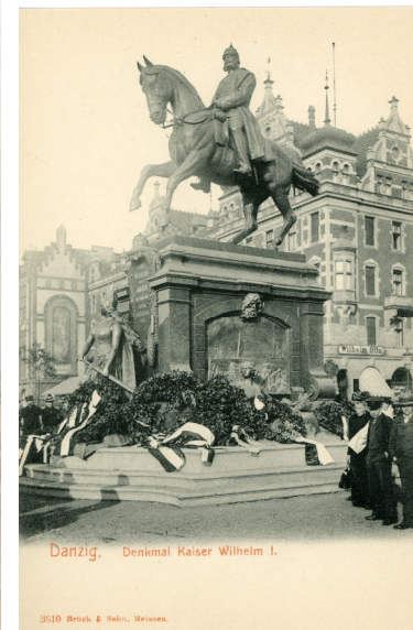
Das Hohe Tor mit der Hauptwache und das Kaiser Wilhelm Denkmal 1906 (Historische Postkarten)

Das Hohe Tor diente als Haupttor der Stadt. Es ist mit allegorischen Figuren aus dem Jahre 1648 geschmückt, die von Peter Ringering geschaffen und mit der Aufschrift „Friede, Freiheit, Eintracht“ versehen wurden. Über den Bögen verziern die Wappen Danzigs, Polens und Preußens das Tor. Im Tor befanden sich drei bogenförmige Durchgänge, deren mittlerer als Durchfahrt diente. 290 Jahre lang blieb das Tor fast unverändert. 1861 wurden die Fassaden renoviert. 1878 wurde das Innentor abgebrochen, um die Durchfahrt zu verbreitern. 1884 wurden die noch im Rohzustand befindlichen Teile der Backsteinwände mit Buckelsteinplatten belegt. 1903 wurde vor dem Hohen Tor/ Hauptwache das von Eugen Boermel geschaffene Denkmal für Kaiser Wilhelm I. errichtet. Es trägt die Wid-