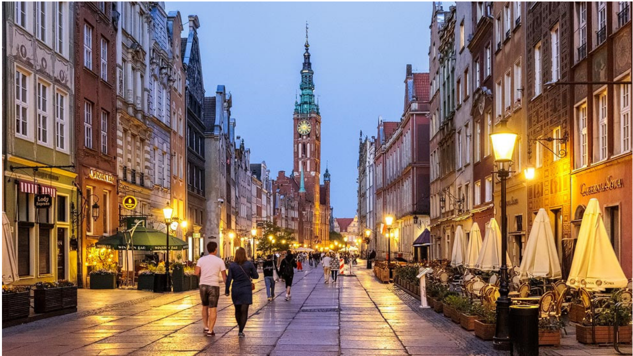
Die Langgasse heute

Das Zentrum und aus touristischer Sicht der wichtigste Bereich in Danzig ist der historische Königsweg im Herzen der Rechtstadt. Auf einer Länge von rund 500 Metern reihen sich entlang der Fußgängerzone Langgasse die schönsten Bauwerke sowie Patrizierhäuser aneinander und verleihen dem Ort eine magische Atmosphäre. Von Westen nach Osten, mit dem Hohen Tor beginnend, gleich danach der Stockturm – in dem sich heute das Bernsteinmuseum befindet – endet er schließlich am Goldenen Tor (Langgasser Tor), das 1612-1614 von Abraham van den Block erbaut wurde. „ Es müsse wohlgehen denen, die dich lieben. Es müsse Frieden sein inwendig in deinen Mauern und Glück in deinen Palästen “ lautet die Aufschrift.