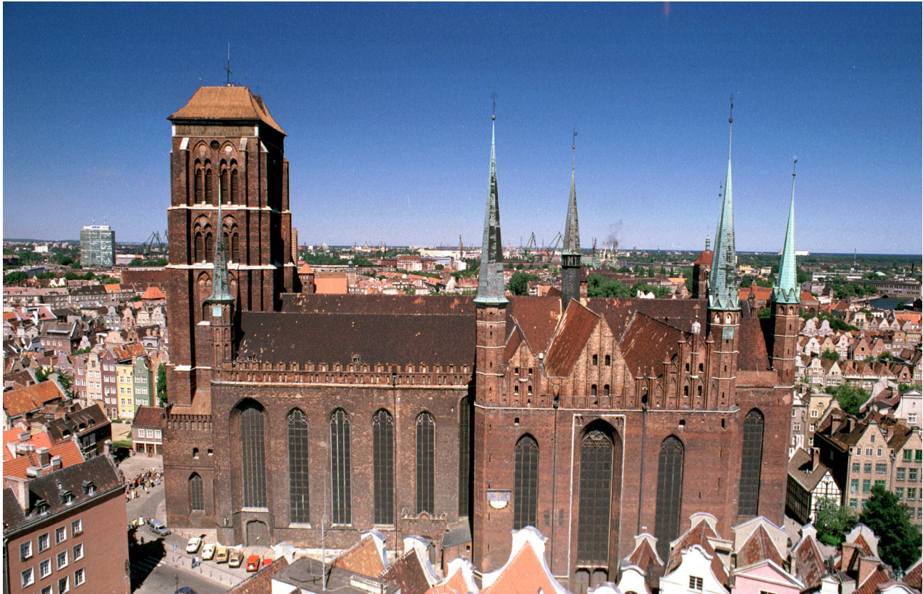
Die Marienkirche in Danzig

und zunächst für katholische, als auch für protestantische Gottesdienste genutzt. Doch schon nach einiger Zeit stand die Marienkirche in Danzig ausschließlich den Mitgliedern der lutherischen Kirche zur Verfügung. Erst seit dem Jahr 1945 ist die Kirche ein katholisches Gotteshaus. Die Marienkirche in Danzig ist genauso wie das Krantor dem Stil der Backsteingotik zuzuordnen. Die Kirche