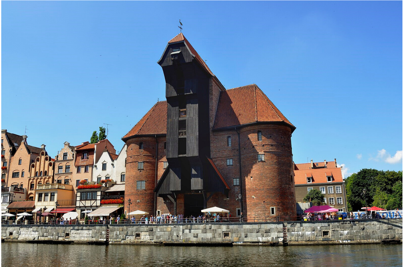
Das Krantor in Danzig