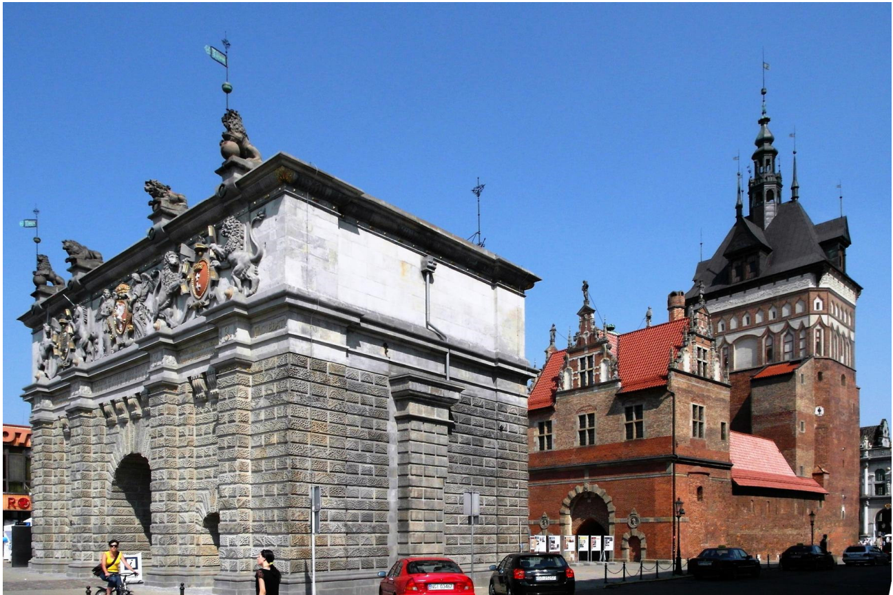
Das Hohe Tor und der Stockturm heute

Direkt hinter dem Hohen Tor erhebt sich der Stockturm. Er entstand am Anfang des vierzehnten Jahrhunderts am Kohlenmarkt als Teil der Befestigungsanlagen der Danziger Rechtstadt. Mit dem Peinkammertor bildete er das Verteidigungswerk der Langgasse. Als der Stockturm im Jahr 1604 seine Bedeutung als Teil der Befestigungsanlagen Danzigs verloren hatte, wurde er zum Gefängnis umfunktioniert.