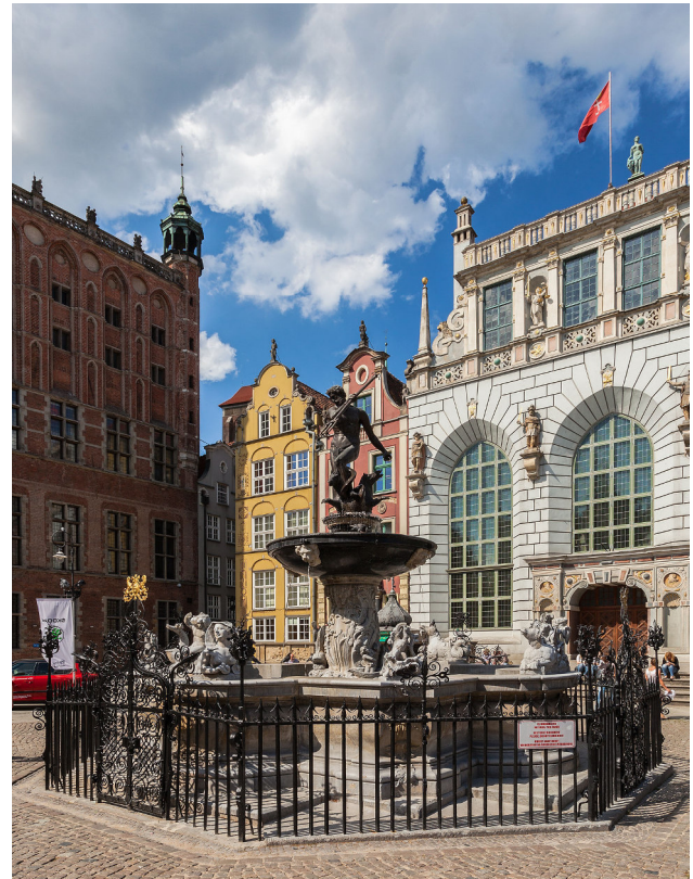
Neptunbrunnen vor dem Artushof