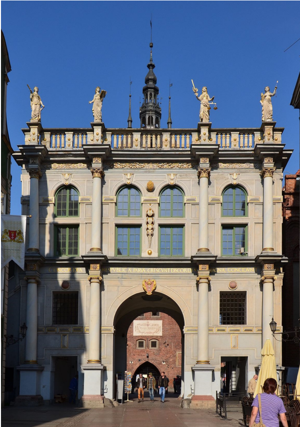
Das Goldene Tor von der Langgasse aus gesehen; die Turmspitze in der Mitte gehört zum dahinter stehenden Stockturm