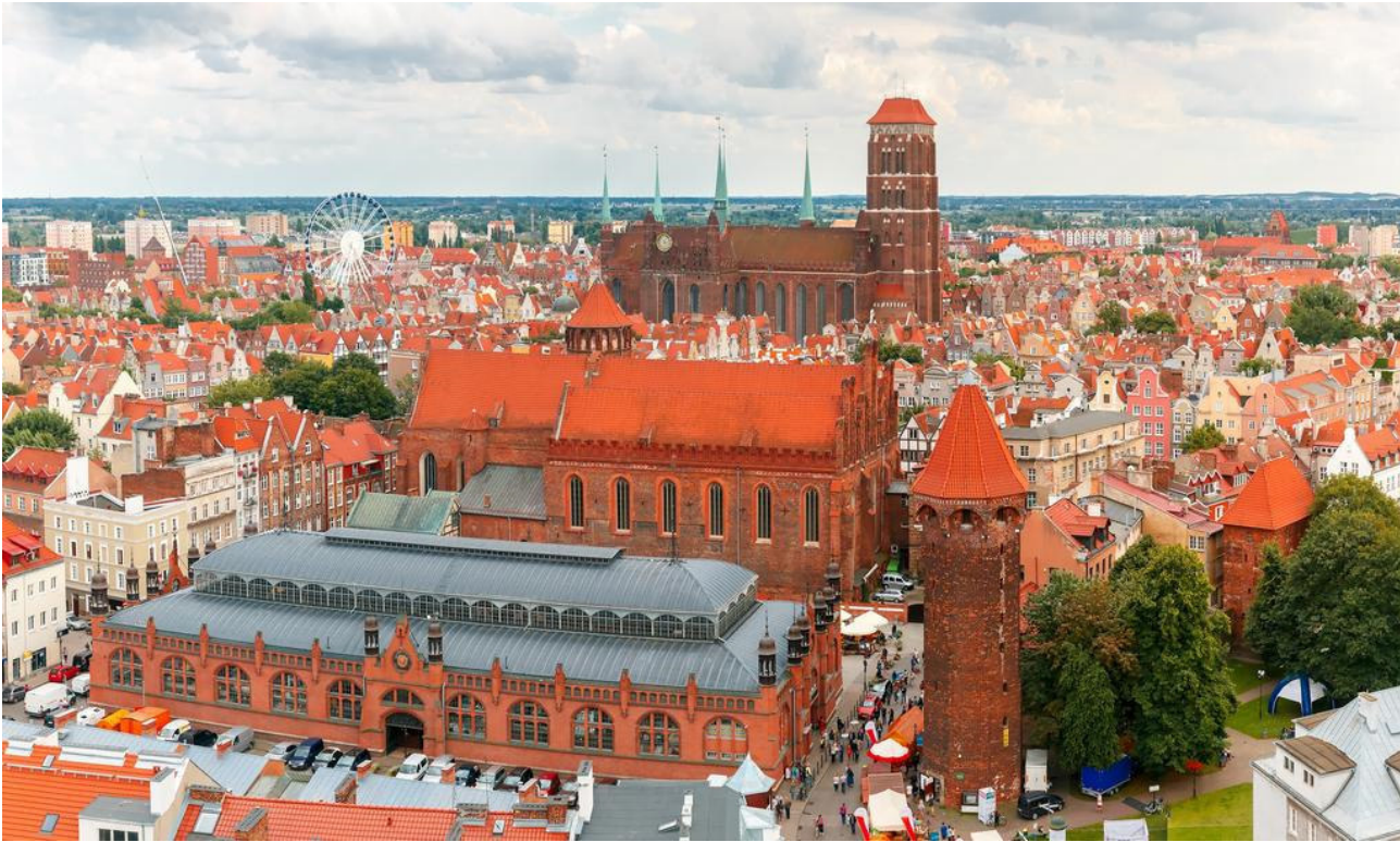
Blick auf Danzig

Die Geschichte von Danzig (polnisch: Gdańsk), einer bedeutenden Hafenstadt an der Ostsee, reicht weit zurück. Die Stadt wurde im 10. Jahrhundert gegründet und schnell zu einem wichtigen Handelszentrum in der Region. Im Laufe der Jahrhunderte wechselte die Herrschaft über Danzig mehrmals, was zu einer vielschichtigen Geschichte führte. Im Jahr 1308 wurde Danzig Teil des Deutschen Ordens und erlebte unter seiner Herrschaft eine Blütezeit als Handelsstadt. Die Hanse, ein mittelalterlicher Handelsbund, trug zur wirtschaftlichen Entwicklung von Danzig bei und machte es zu einem bedeutenden Mitglied der Hansestädte.