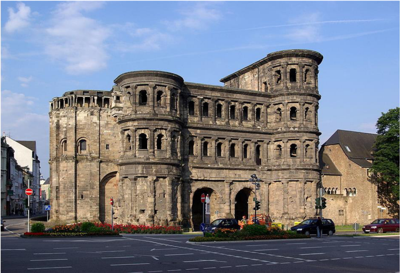
Die stadttäußere Feldseite des Trierer Römertors „Porta Nigra“. Links im Bild der spätere Choranbau, rechts ein Klostergebäude des Simeonstifts.

Richtung angelegte Hauptachse der römischen Stadt – von Süden kommend das Nordtor. Von dort ging es dann auf die Fernstraßen nach Mainz und Koblenz.