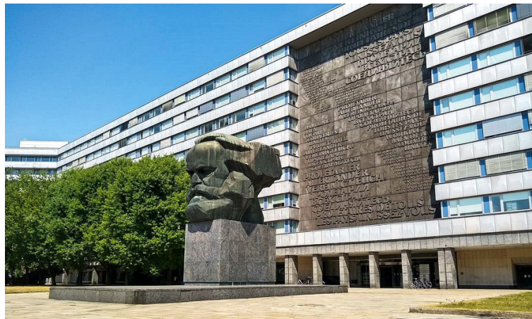
Das Karl-Marx-Monument in Chemnitz (in der DDR: Karl-Marx-Stadt)

In London begann sein intensives Studium der klassischen Nationalökonomie. Nach jahrelanger Vorarbeit veröffentlichte er 1867 den ersten Band seines theoretischen Hauptwerks „Das Kapital“, einer klassischen Kritik der kapitalistischen Produktionsweise, die zum Beispiel wegen der Einführung des Begriffs „Mehrwert“, der sich aus dem Verkauf der Arbeitskraft durch den Arbeiter ergibt, bis heute prägend ist. Seine Tätigkeit als Schriftsteller unterbrach Marx immer wieder für politische Aktivitäten, darunter die Mitbegründung und Fortentwicklung der Internationalen Arbeiter-Assoziation (IAA) zwischen 1864 und 1876.