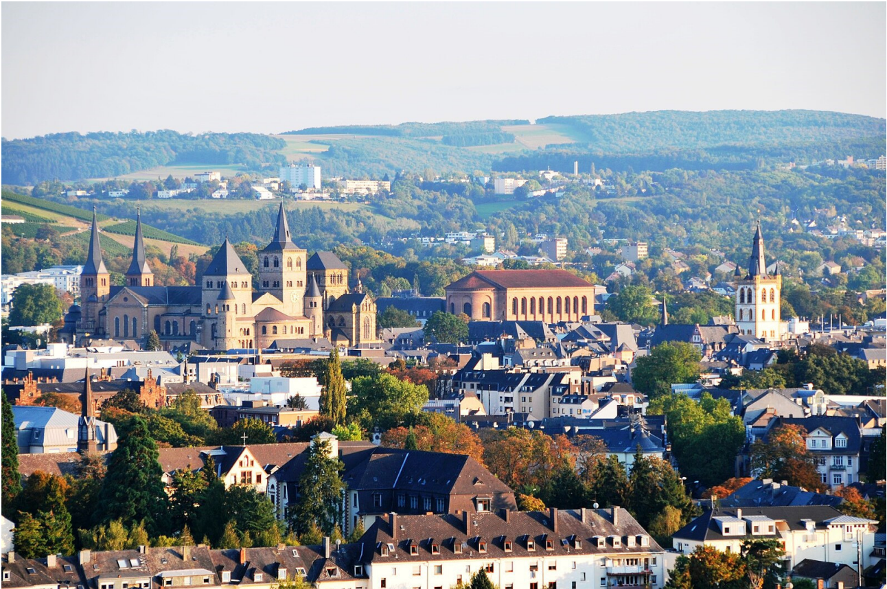
Blick auf die Altstadt von Trier

Trier ist die älteste Stadt Deutschlands mit einer mehr als 2000-jährigen Geschichte. Als „Augusta Treverorum“ wurde das heutige Trier 17 v. Chr. von den Römern unter Kaiser Augustus in der Nähe eines Stammesheiligtums der keltischen Treverer gegründet. Im Jahre 293 ernannte Kaiser Diokletian die zu dem Zeitpunkt Trevisis genannte Stadt zur römischen Kaiserresidenz und Hauptstadt des weströmischen Reiches.