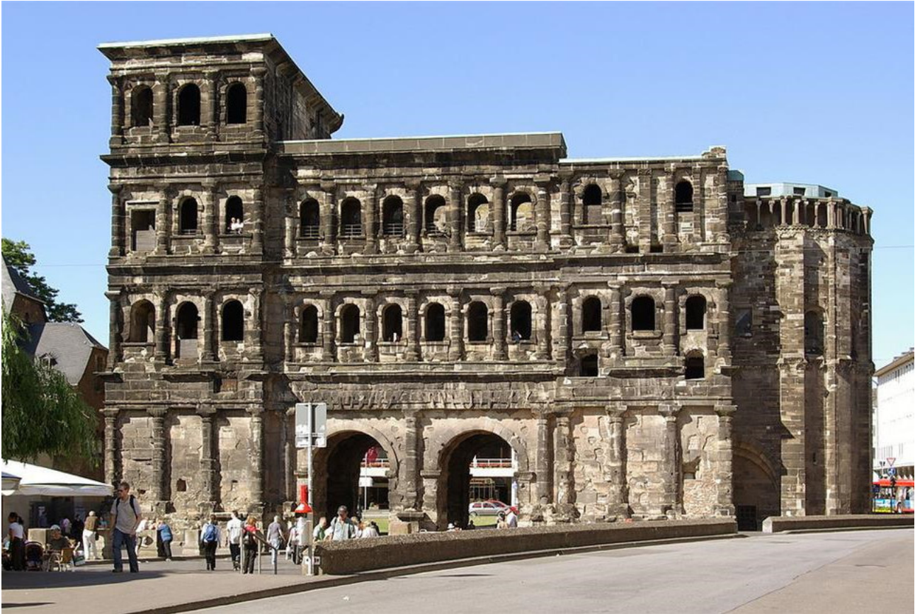
Die stadttinnere Seite des Trierer Römertors „Porta Nigra“. Rechts im Bild der Choranbau der späteren Doppelkirchenanlage

Dass der Bau unvollendet blieb, hängt aller Wahrscheinlichkeit nach mit einem Aufstand zur Zeit der Erbauung des Tors im Jahre 197 zusammen, bei dem die Stadt belagert wurde. Die Bauarbeiten wurden auf Grund der plötzlichen Bedrohung unterbrochen und in der Folge nicht mehr fortgeführt. Die raue Struktur der Maueroberfläche ist eine Folge der Nicht-Vollendung; eigentlich sollte das Tor nach seiner Fertigstellung geschliffen und wohl auch mit einer glatten Putzschicht versehen werden. Da dies nicht geschah, sind an der Porta Nigra heute noch zahlreiche Steinmetzzeichen zu erkennen, welche im Rahmen einer abschließenden Gestaltung des Mauerwerks ansonsten sicher verschwunden wären.