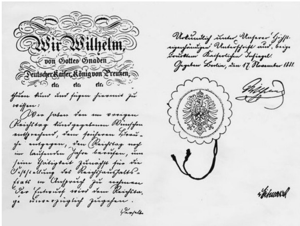
Die Kaiserliche Botschaft

In rascher Folge führt das Deutsche Reich drei gesetzliche Pflichtversicherungen für Arbeiter ein: 1883 die Kranken-, 1884 die Unfall-, 1889 die Invaliden- und Altersversicherung, Vorläuferin der Rentenversicherung. Weltweit ist es das erste, grobmaschige soziale Netz.