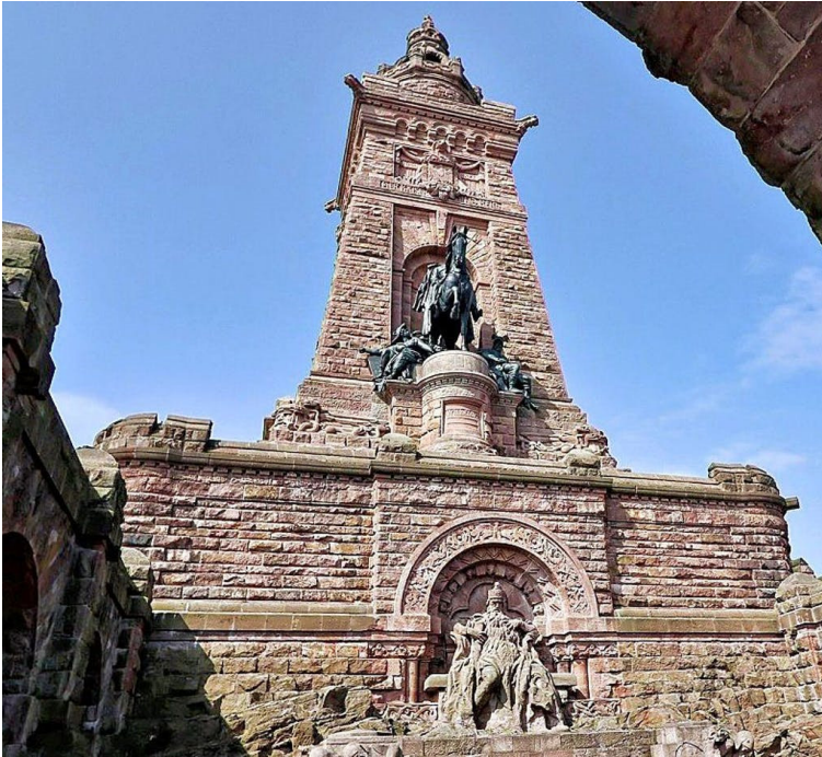
Kyffhäuserdenkmal mit Kaiser Barbarossa und Kaiser Wilhelm I.

Die Idee zum Bau einer monumentalen Denkmalanlage zu Ehren Kaiser Wilhelm I. entstand bereits kurze Zeit nach dessen Tod im Jahre 1888. Der Standort auf dem Kyffhäuser wurde gewählt, da dem allgemeinen Empfinden nach Wilhelm I. den hier der Barbarossasage nach im Berg schlafenden Kaiser „Rotbart“ erlöst habe. Nach dem Völkerschlachtdenkmal in Leipzig ist es das zweitgrößte Nationaldenkmal in Deutschland.