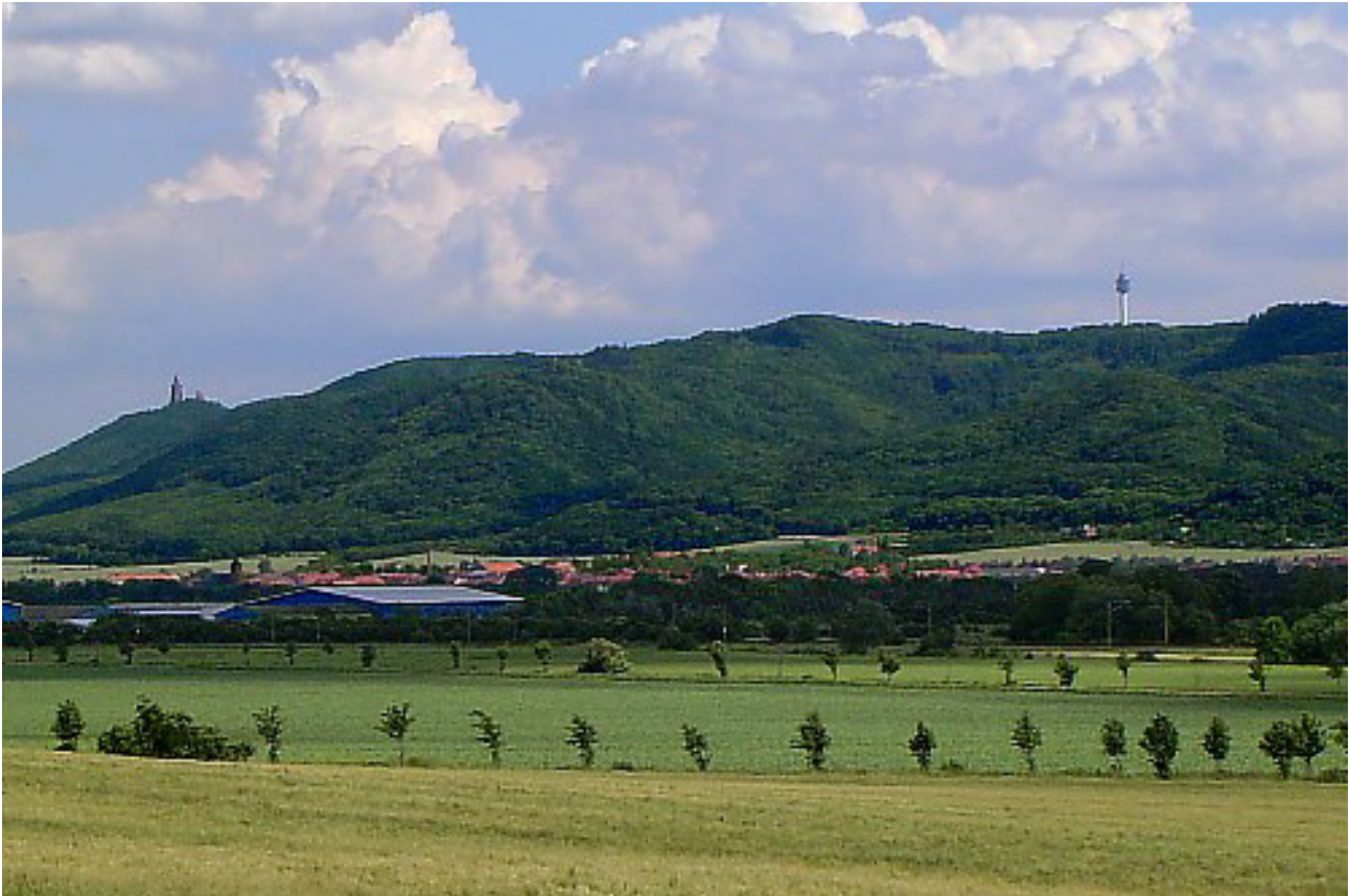
Blick von der Goldenen Aue auf das Kyffhäusergebirge

Das sagenumwobene Kyffhäusergebirge, auch kurz „Kyffhäuser“ genannt, befindet sich südlich des Harzes in Sichtweite zu diesem. Es liegt eingebettet zwischen der „Goldenen Aue“ im Norden und der „Diamantenen Aue“ im Süden. Der größte Teil des Gebirges gehört zum Bundesland Thüringen, einige kleine nördliche Randbereiche jedoch zum Gebiet von Sachsen-Anhalt.