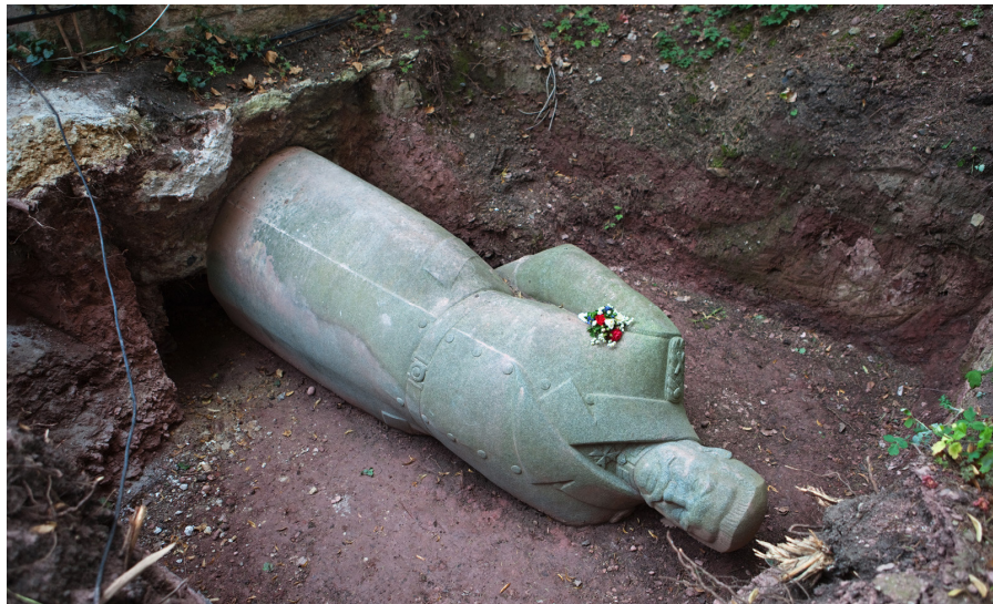
Das Hindenburgdenkmal heute