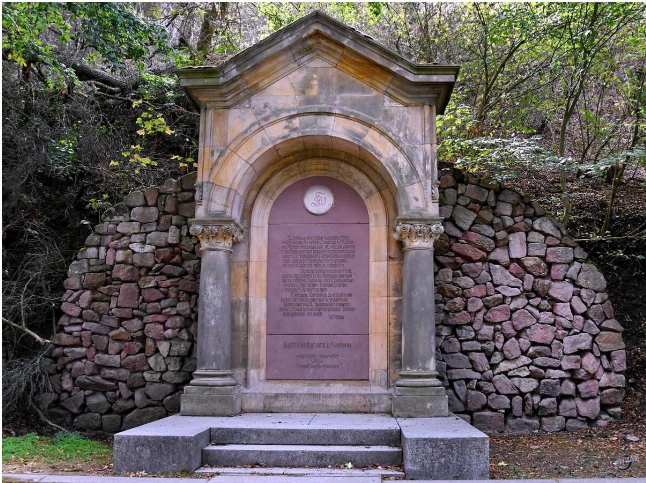
Der Botschaftsgedenkstein heute

Äußeres Zeichen dieses Engagements war die Errichtung des so genannten „Botschaftsgedenksteins“. Dieser zeigte einen Teil des Textes der Kaiserlichen Botschaft auf einer Bronzetafel, die von einem romanischen Bogen umgeben war. Mit dem Botschaftsgedenkstein weihte der Kyffhäuser-Verband am 8. August 1896 ein in seiner Aussage einzigartiges Denkmal ein. Bis zum Juni 1960 verblieb die Bronzetafel an ihrem Bestimmungsort, bis sie im Auftrag des Rates des Kreises demontiert und zerstört wurde. Anstelle der Bronzetafel wurde im romanischen Bogen des Denkmals ein Übersichtsplan der Wanderwege am Kyffhäuser angebracht.