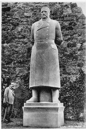
Hindenburg Denkmal auf dem Kyffhäuser Hindenburgdenkmal (Historische Postkarte)

Der Freistaat Thüringen, verärgert über die Raubgräberei, erhob Anspruch auf das Werk. Da ein Abtransport aber zu aufwändig geworden wäre, soll – als zeitgemäße Interpretation des schweren Erbes – eine Panzerglasscheibe Hindenburg bedecken, Erklärungstafel inklusive.