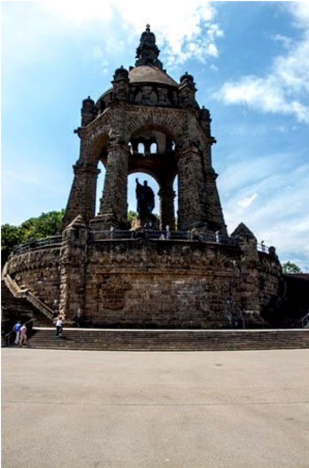
Kaiser Wilhelm Denkmal

des Denkmals ein Restaurant und ein Ausstellungsraum. Nach dem Umbau wurde das Denkmal am 8. Juli 2018 feierlich neu eröffnet.