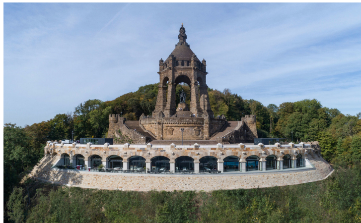
Das Denkmal heute mit neu errichteter Ringterrasse

Das Lied „An der Weser“ oder „Das Weserlied“ wurde 1835 von Franz von Dingelstedt in Todenmann bei Rinteln gedichtet und später von Gustav Pressel vertont. Das Lied ist zu einem Volkslied geworden.