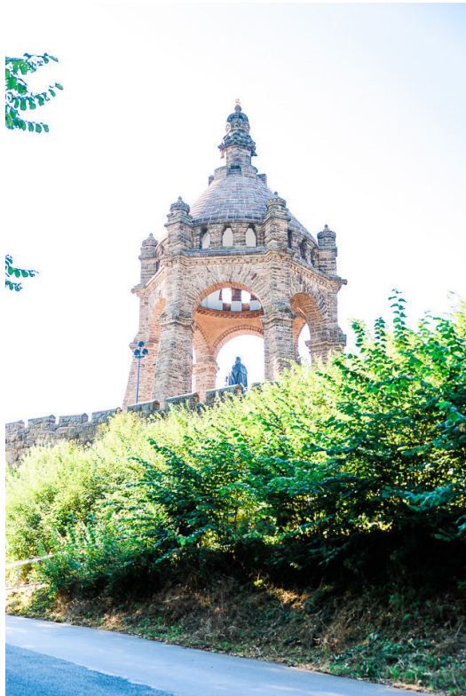
Blick zum Kaiser Wilhelm Denkmal

Das Kaiser-Wilhelm-Denkmal auf dem Wittekindsberg in 268 Meter Höhe gehört zu den bedeutendsten Nationaldenkmälern Deutschlands. Es erinnert an Wilhelm I., König von Preußen (1797-1888) und seit 1871 Deutscher Kaiser.