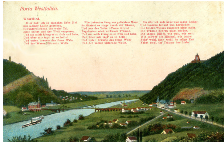
Porta Westfalica und Weserlied (Feldpostkarte 1914)

Die süßen Bilder, wie weit, wie weit! Wie schwer der Himmel, wie trübe! Fahr wohl, fahr wohl, du selige Zeit! Fahrt wohl, ihr Träume der Liebe.