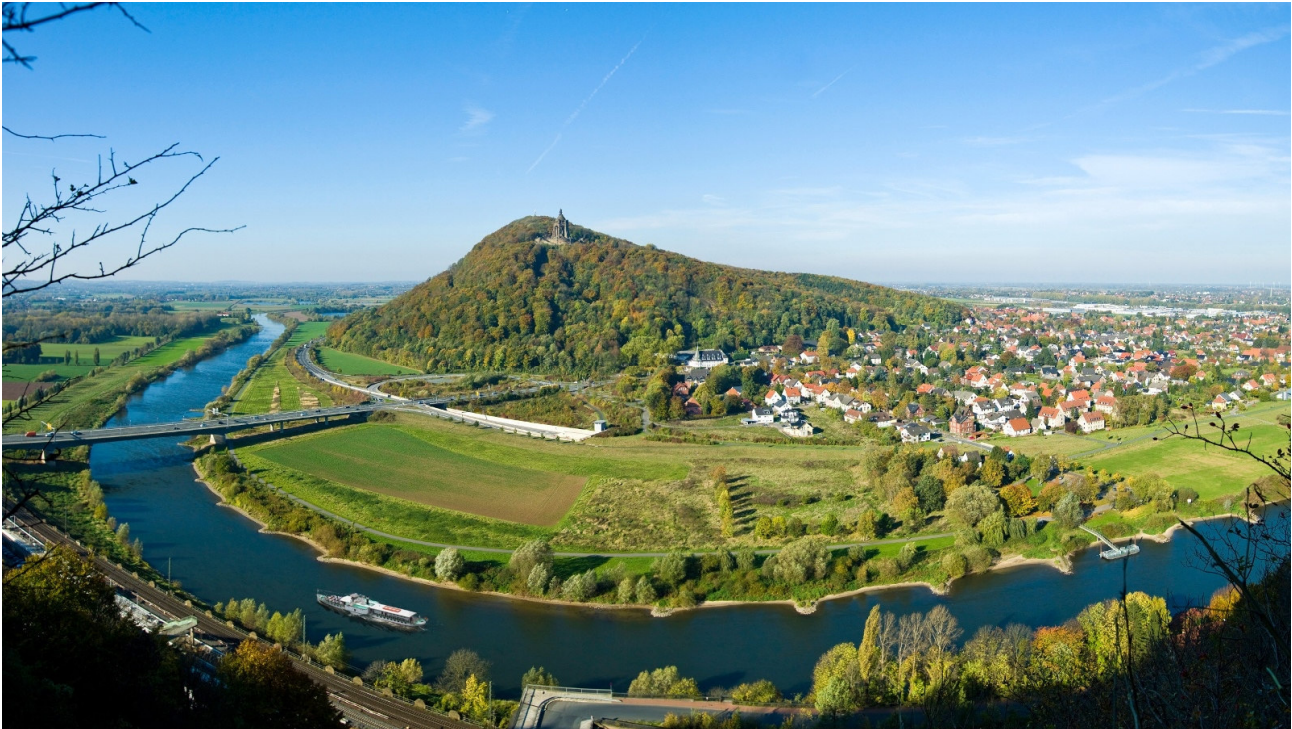
Panoramablick Porta Westfalica

Die Porta Westfalica ist der Taleinschnitt zwischen Weser- und Wiehengebirge, durch den die Weser in die Norddeutsche Tiefebene fließt. Vermutlich im Paläogen entstanden, hat diese Tallandschaft wegen ihrer zentralen Lage geschichtlich immer eine Rolle gespielt, z. B. während der Auseinandersetzungen zwischen Römern und Germanen und später den Franken unter Karl dem Großen und den Sachsen unter Herzog Wittekind. Zeugen aus der Vergangenheit, wie die alten Wallburgen, erinnern daran. Die erste kontinuierliche Besiedlung erfolgte mutmaßlich erst in der sächsischen Zeit. 1896 wird das Wahrzeichen der Stadt, das Kaiser-Wilhelm-Denkmal erbaut.