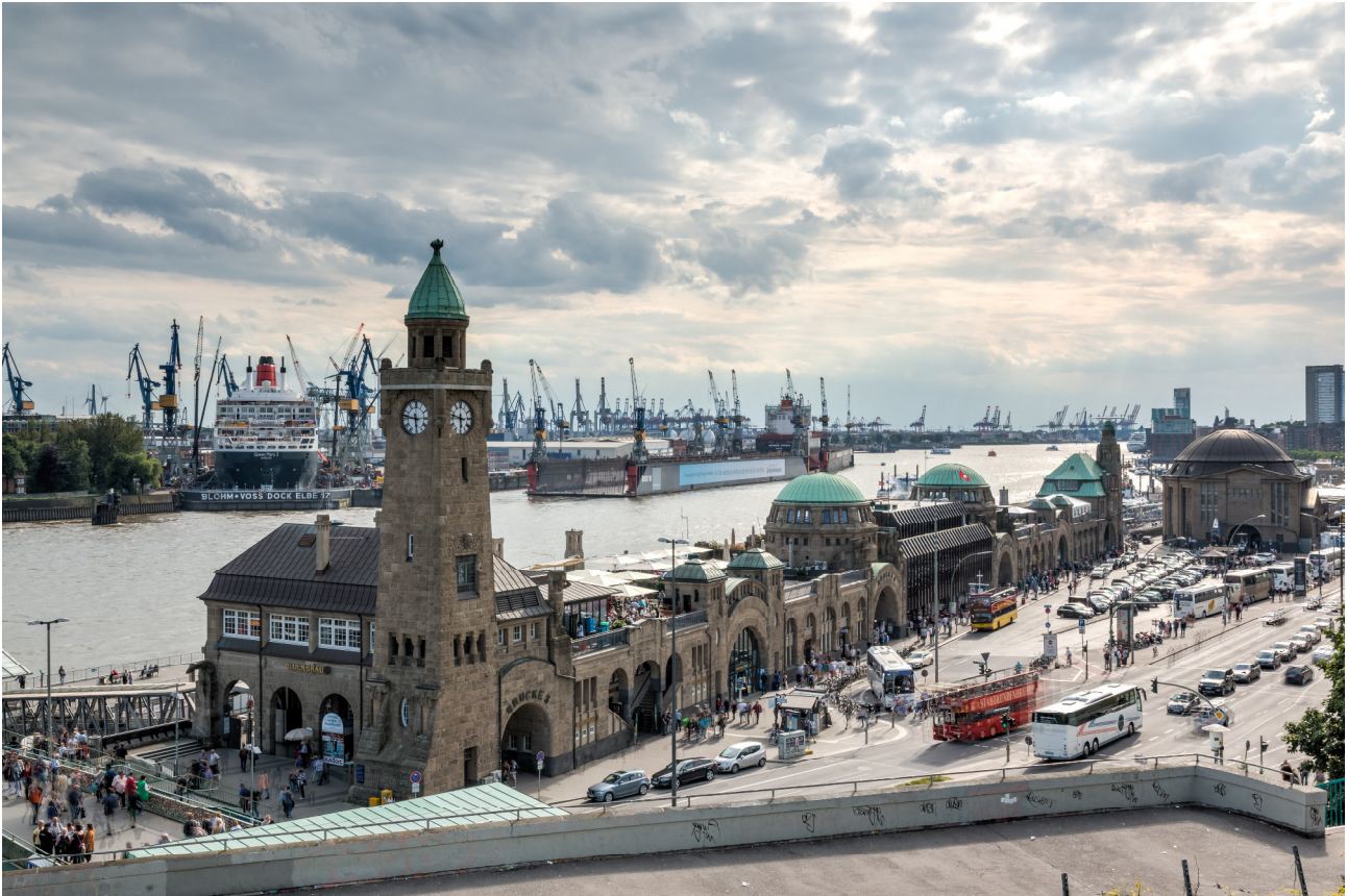
Hamburger Hafen mit Landungsbrücken

Die Geschichte Hamburgs reicht bis in das 4. Jahrhundert v. Chr. zurück. Aus dieser Zeit datieren die ältesten festen Behausungen für die Ortschaft, die von dem antiken Wissenschaftler Claudius Ptolemäus noch als Treva bezeichnet wurde. Vom 4. bis ins 6. Jahrhundert siedelten sich Sachsen im nordelbischen Raum an.