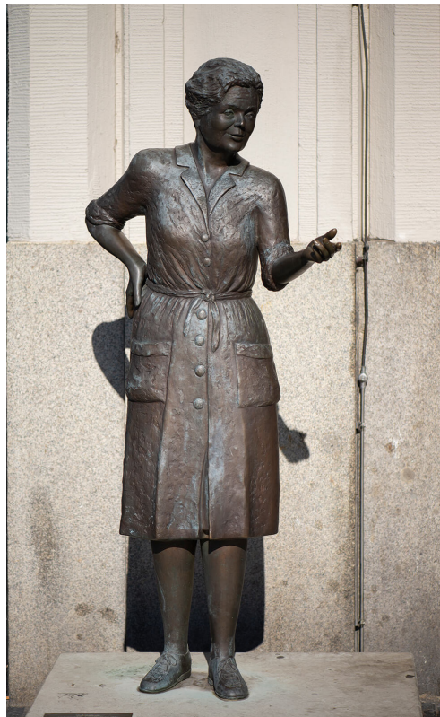
Denkmal Heidi Kabel

Erst durch ihre Interpretation wurde das Lied „In Hamburg sagt man Tschüss“ Deutschlandweit bekannt.