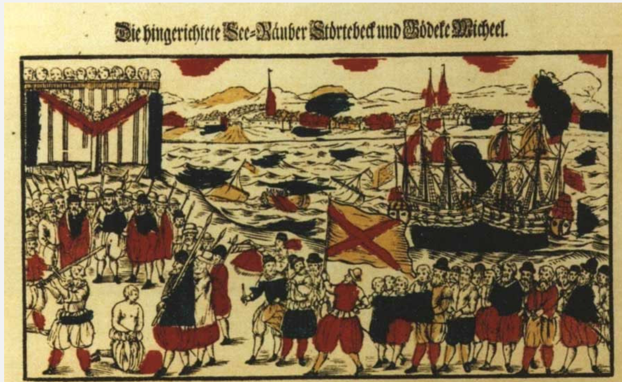
Hinrichtung der Vitalienbrüder auf dem Grasbrook in Hamburg. Flugblatt aus dem Jahre 1701

Die öffentliche Hinrichtung der Piraten fand am 20. Oktober 1401 in Hamburg auf dem Grasbrook, der heutigen HafenCity, statt. Sie ließ den schon zu Lebzeiten berühmten Klaus Störtebeker vollends zur Legende werden. Denn Störtebeker äußerte einen letzten Wunsch an den Hamburger Bürgermeister: Er wolle sich als erster dem Schwert des Scharfrichters stellen. Doch die Männer seiner Mannschaft, an denen er geköpft noch vorbeilaufen könne, sollten die Freiheit geschenkt bekommen. Der Bürgermeister gab Störtebeker sein Versprechen. An elf Männern soll Klaus Störtebeker enthauptet vorbeigelaufen sein, bevor der Scharfrichter ihm, so will es die Geschichte, ein Bein stellte. Kurz darauf brach der Bürgermeister sein Versprechen und ließ Störtebekers gesamte Mannschaft hinrichten.