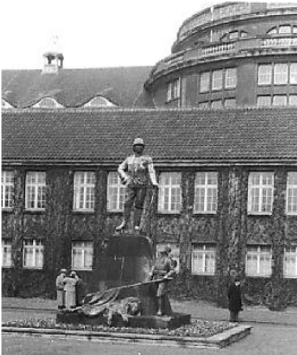
Wissmann-Denkmal in Hamburg 1925

wurde das Denkmal daher nach London verbracht und im Imperial War Museum als Kriegstrophäe der Öffentlichkeit zugänglich gemacht. Auf Bitten der Kolonialbewegung konnten deutsche Regierungsvertreter die Freigabe des Denkmals aushandeln. 1922 wurde es vor der Universität Hamburg aufgestellt. Während der Weimarer Republik und der NS-Zeit stand das Wissmann-Denkmal immer wieder im Zentrum kolonialrevisionistischer Feierlichkeiten, auf denen die Rückgabe der Kolonien an Deutschland gefordert wurde.