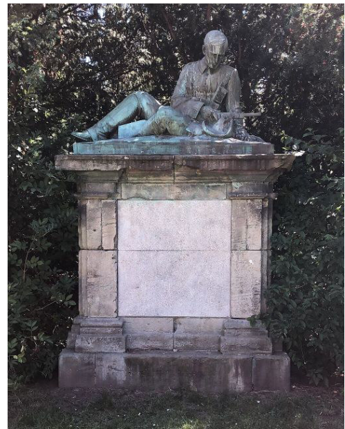
Das Kolonialdenkmal heute