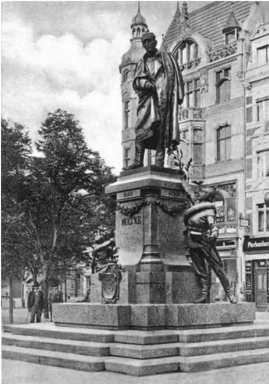
Das Moltke-Denkmal 1906 (Historische Postkarte)

Das Moltke-Denkmal in Düsseldorf wurde von den Düsseldorfer Bildhauern Josef Tüshaus und Joseph Hammerschmidt geschaffen und am 27. November 1901 enthüllt. Im Zweiten Weltkrieg wurde das Denkmal durch den Luftangriff vom 3. November 1943 stark beschädigt, erhalten blieb jedoch die Figurengruppe Schmied mit Knabe von Hammerschmidt, die den Denkmalsockel schmückte. Nach dem Entwurf des Architekten Jörg Metz wurde die erhaltene Figurengruppe 1994 auf dem Martin-Luther-Platz vor der Johanneskirche erneut aufgestellt und am 10. Dezember des Jahres eingeweiht.