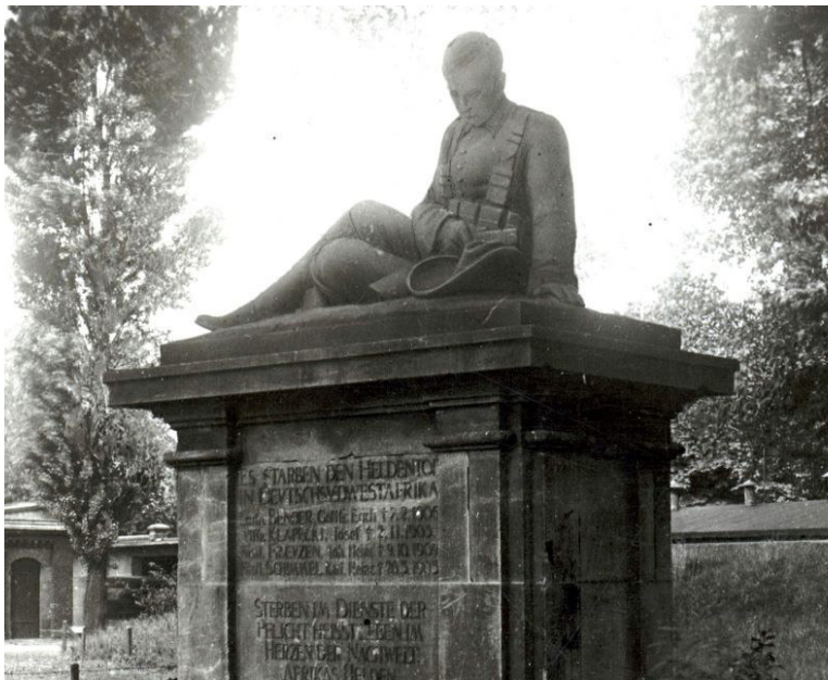
Das Kolonialdenkmal 1935 (Historisches Foto)

Während der Studentenbewegung 1967 kam es einer mutwilligen Zerstörung der Gedenktafel auf dem Denkmalsockel.