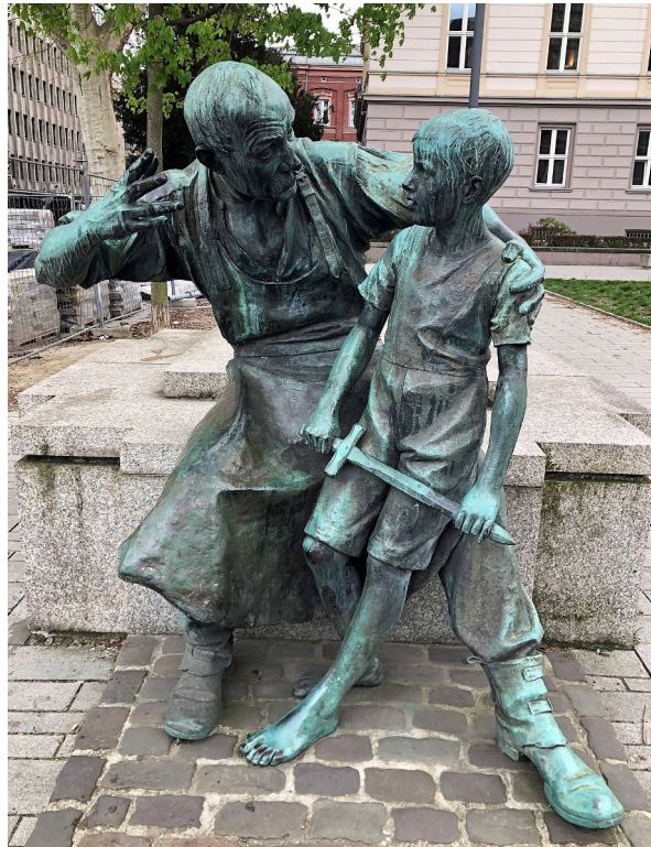
Reste des Moltke-Denkmal heute