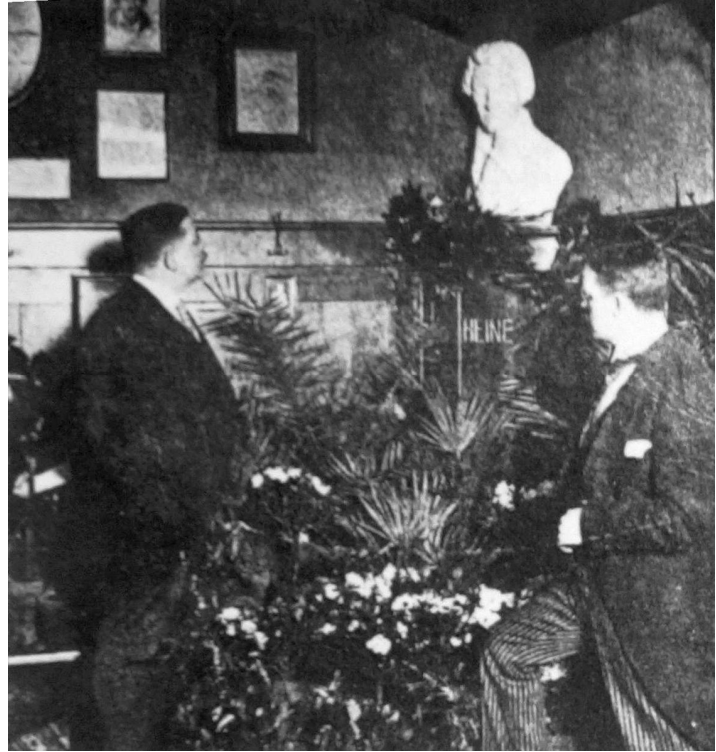
Enthüllung der Heine-Büste 1913