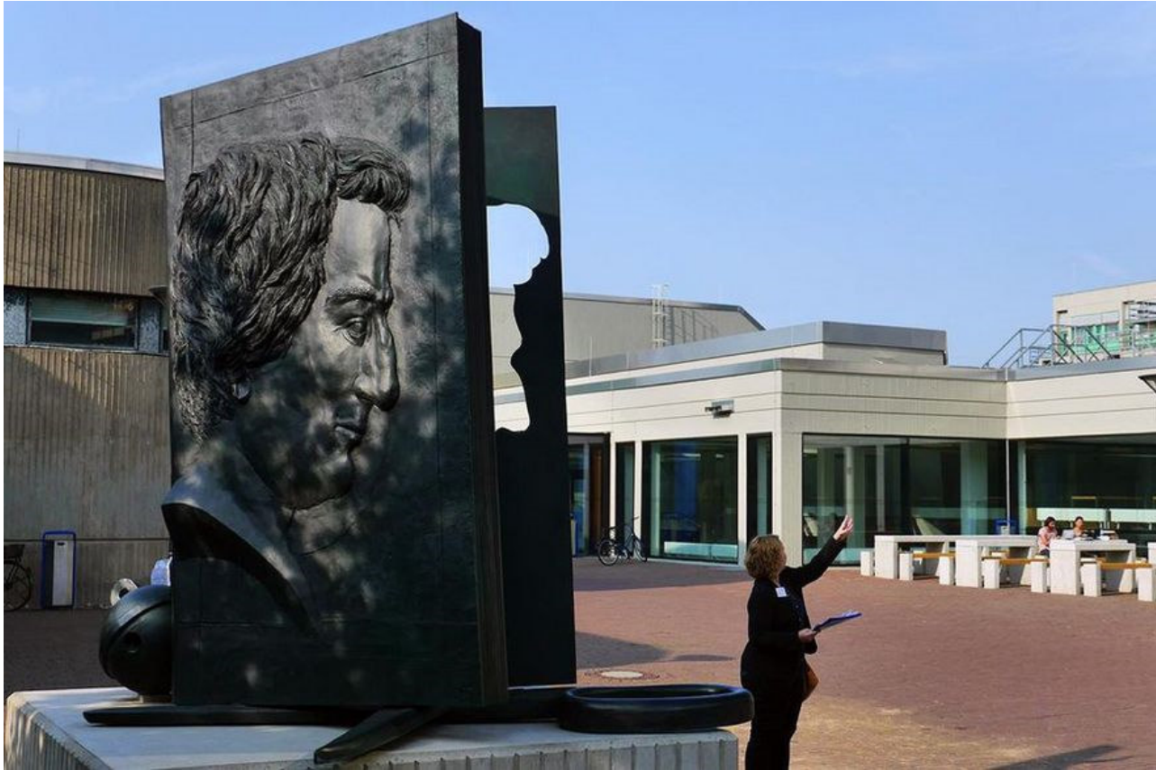
Das Heine-Denkmal an der Universität

und soll, ist ein Auszug aus dem Text „Verschiedene Geschichtsauffassungen“ (1833) zu lesen. Das Denkmal Gerresheims korrespondiert mit der Heine-Statue vor der Universitäts- und Landesbibliothek. Ebenso wie diese steht es auf einem Treppensockel in Form eines Davidsterns.