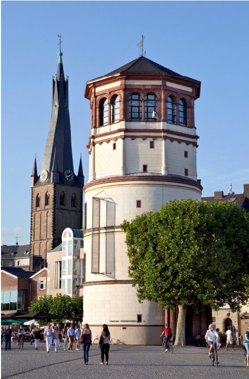
Der Schlossturm heute