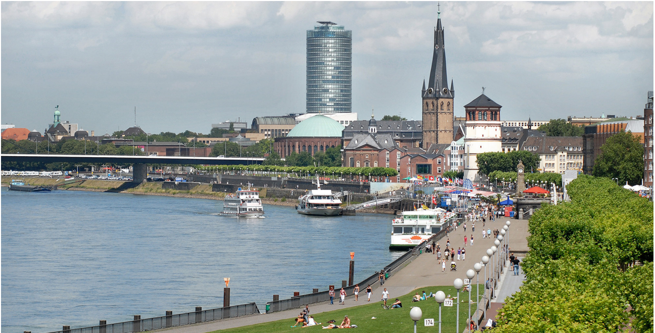
Das Düsseldorfer Rheinufer

Die Stadt Düsseldorf blickt auf eine lange Geschichte vom Dorf bis hin zur Metropole zurück. Mittlerweile hat sich Düsseldorf zu einer bedeutenden Stadt der Kultur, Mode und Medien entwickelt. Die Erfolgsgeschichte Düsseldorfs ist bis heute anhand von Gebäuden und Plätzen nachzuvollziehen.