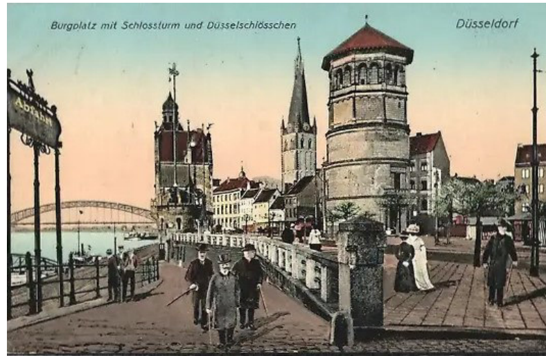
Schlossturm und Düssel-Schlösschen 1919 (Historische Postkarte)