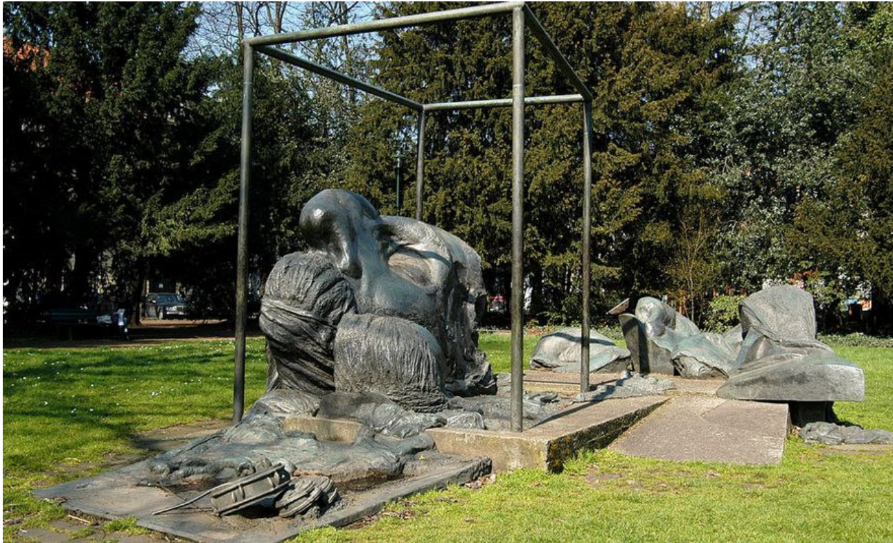
Das Heine-Monument auf dem Schwanenmarkt

kritisch die Möglichkeiten eines Denkmals heute, versteht sich als „Vexierplastik“, das die Totenmaske Heines aufsprengt und sie mit zahlreichen Symbolen umgibt.